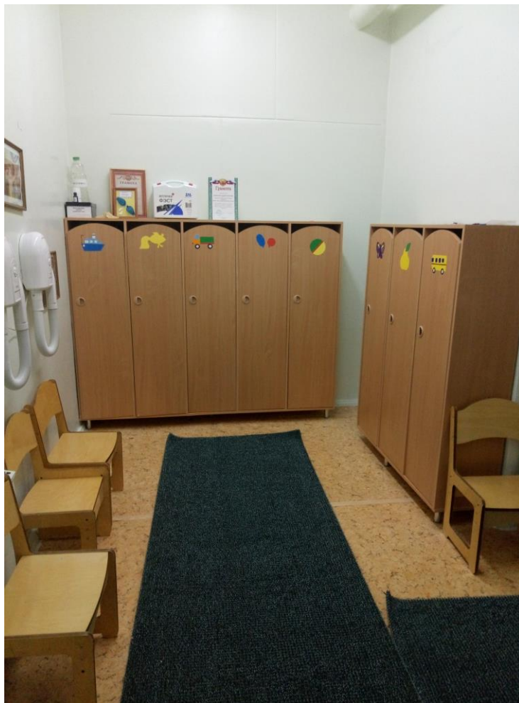
Комната для раздевания